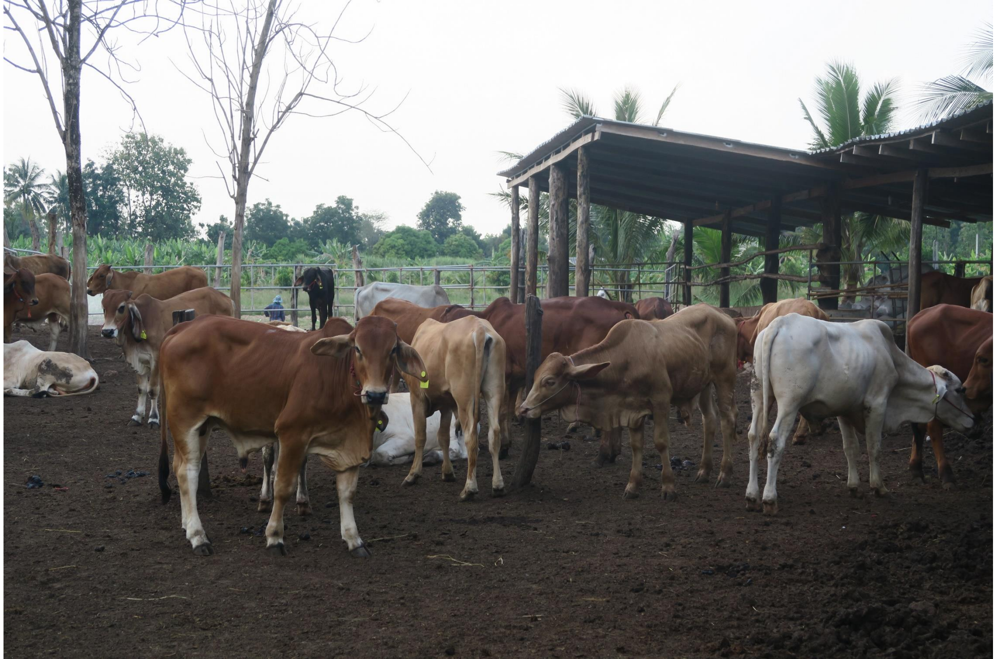
ศูนย์ศึกษาการพัฒนาห้วยทรายฯ จ.เพชรบุรี