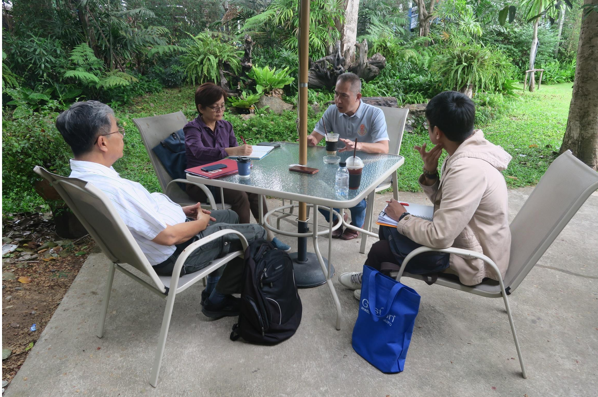
ศูนย์ศึกษาการพัฒนาค่ายทรายฯ จ.เพชรบุรี