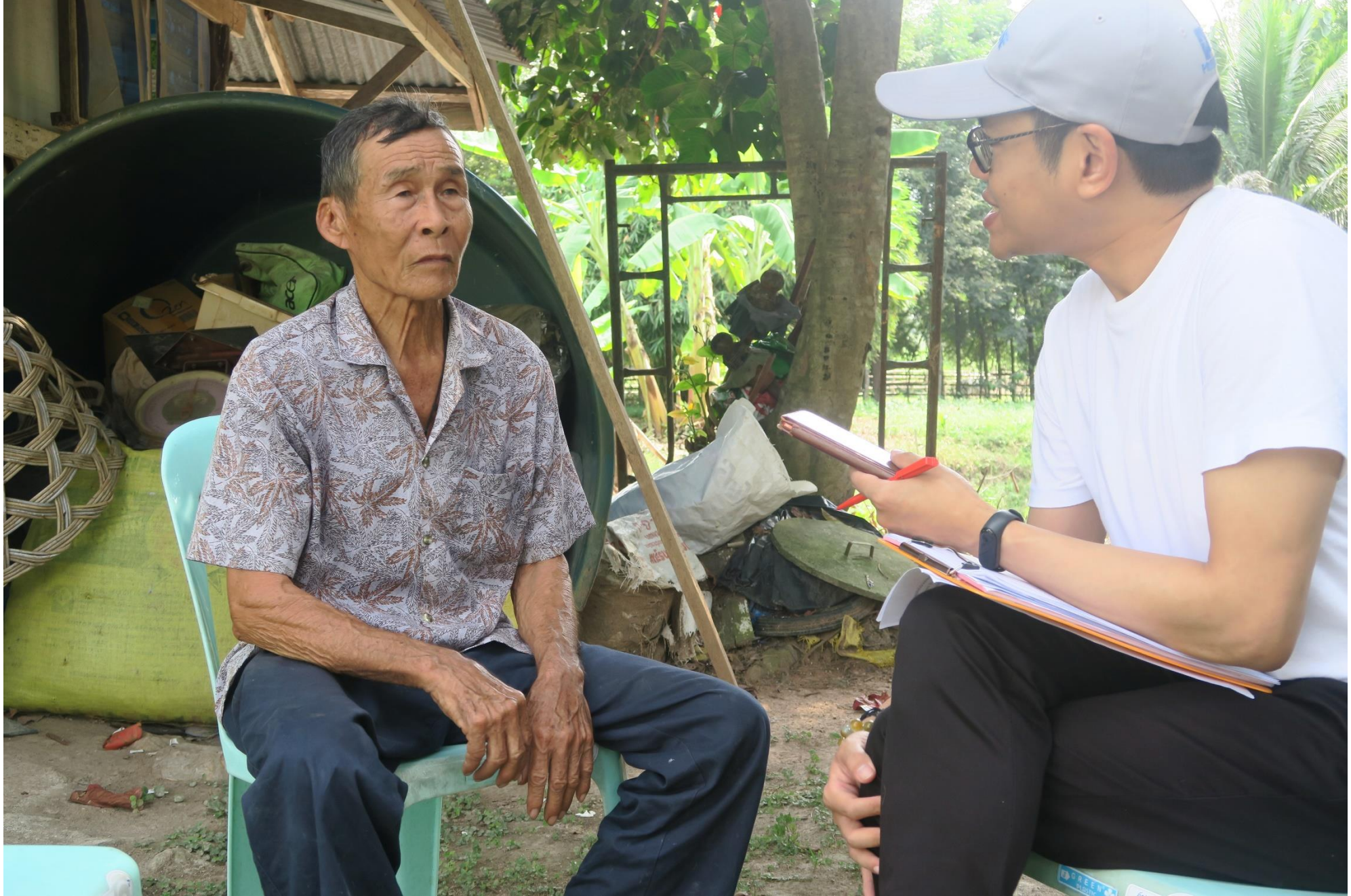
ศูนย์ศึกษาการพัฒนาค่ายทรายฯ จ.เพชรบุรี