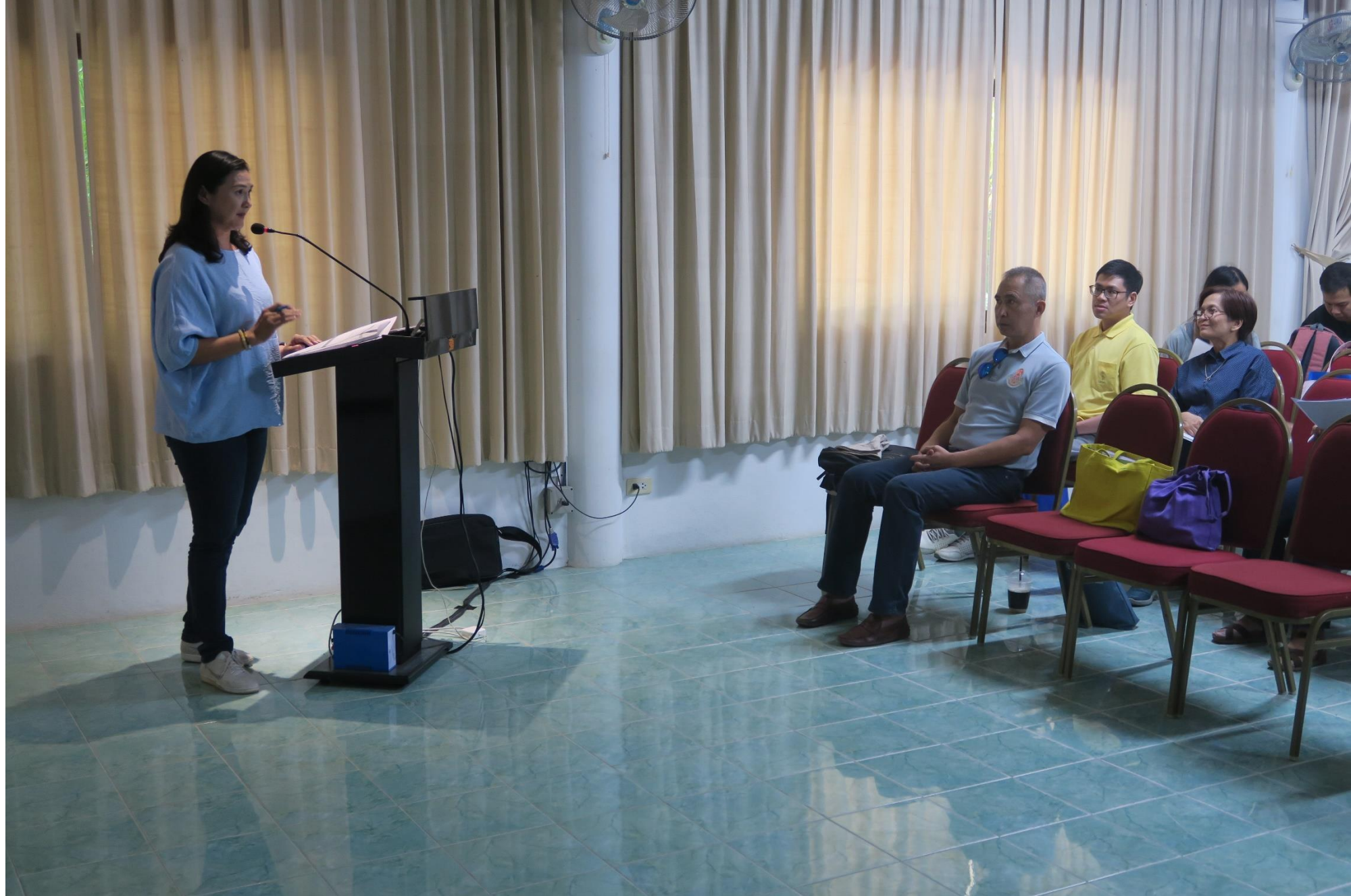
ศูนย์ศึกษาการพัฒนาค่ายทรายฯ จ.เพชรบุรี